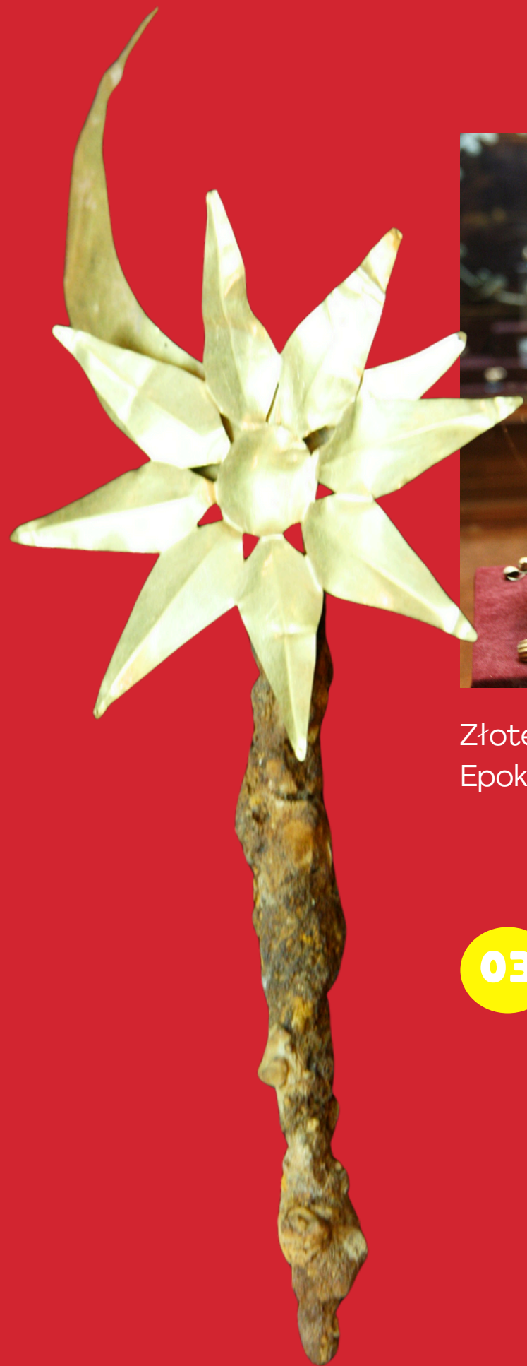
Ozdoba z Gonur Depe, Epoka Brązu, (fot. Wojciech Ejsmond)