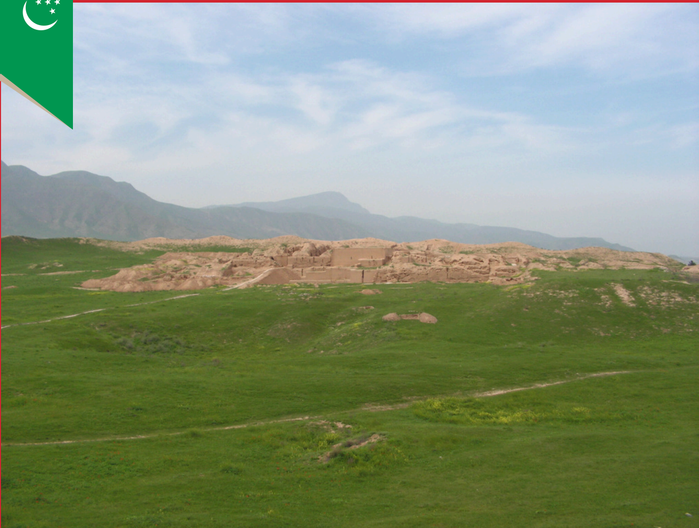
Stara Nisa, 2007