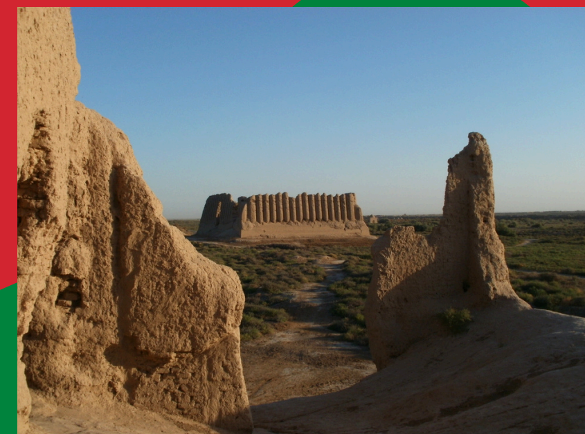
Merw, Kyz Kala, VI-VIII w.