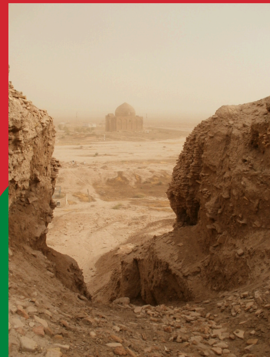
Widok ze Starego Serachsu na mauzoleum Abul-Fazl, XI-XII w