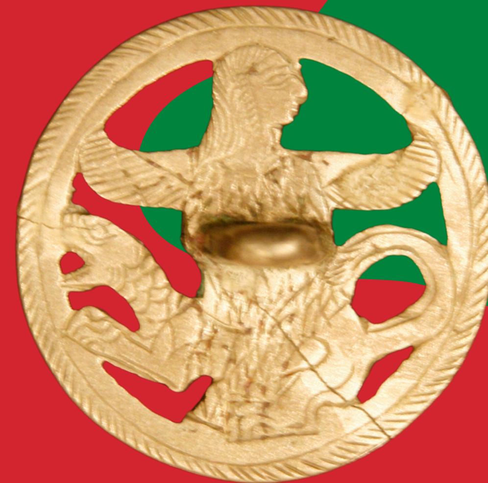
Zabytek z Gonur Depe, Epoka Brązu, (fot. Wojciech Ejsmond)