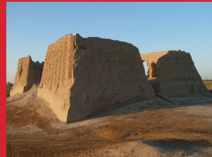
Merw, Kyz Kala, VI-VIII w.