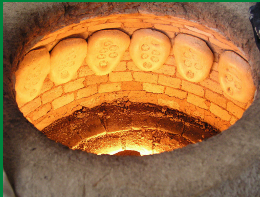
Chleb w piecu