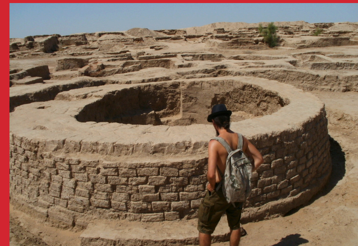
Pozostałości Gonur Depe, Epoka Brązu

Gonur Depe – starożytne miasto funkcjonujące w III i II tys. p.n.e. Wydzielono w nim zespoły pałacowe, świątynne oraz zabudowania mieszkalno-gospodarcze. Jest to jedno z najważniejszych centrów Baktryjsko-Margiańskiego Zespołu Archeologicznego.