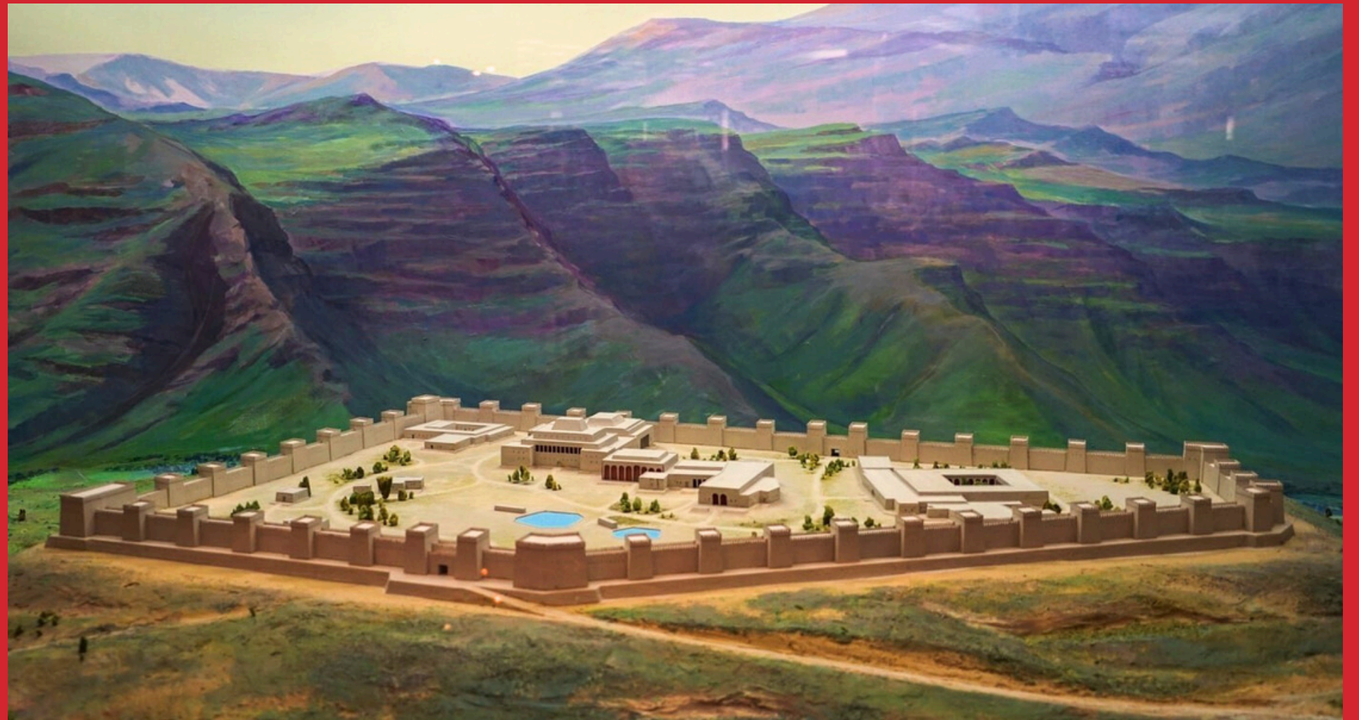
Rekonstrukcja Starej Nisy