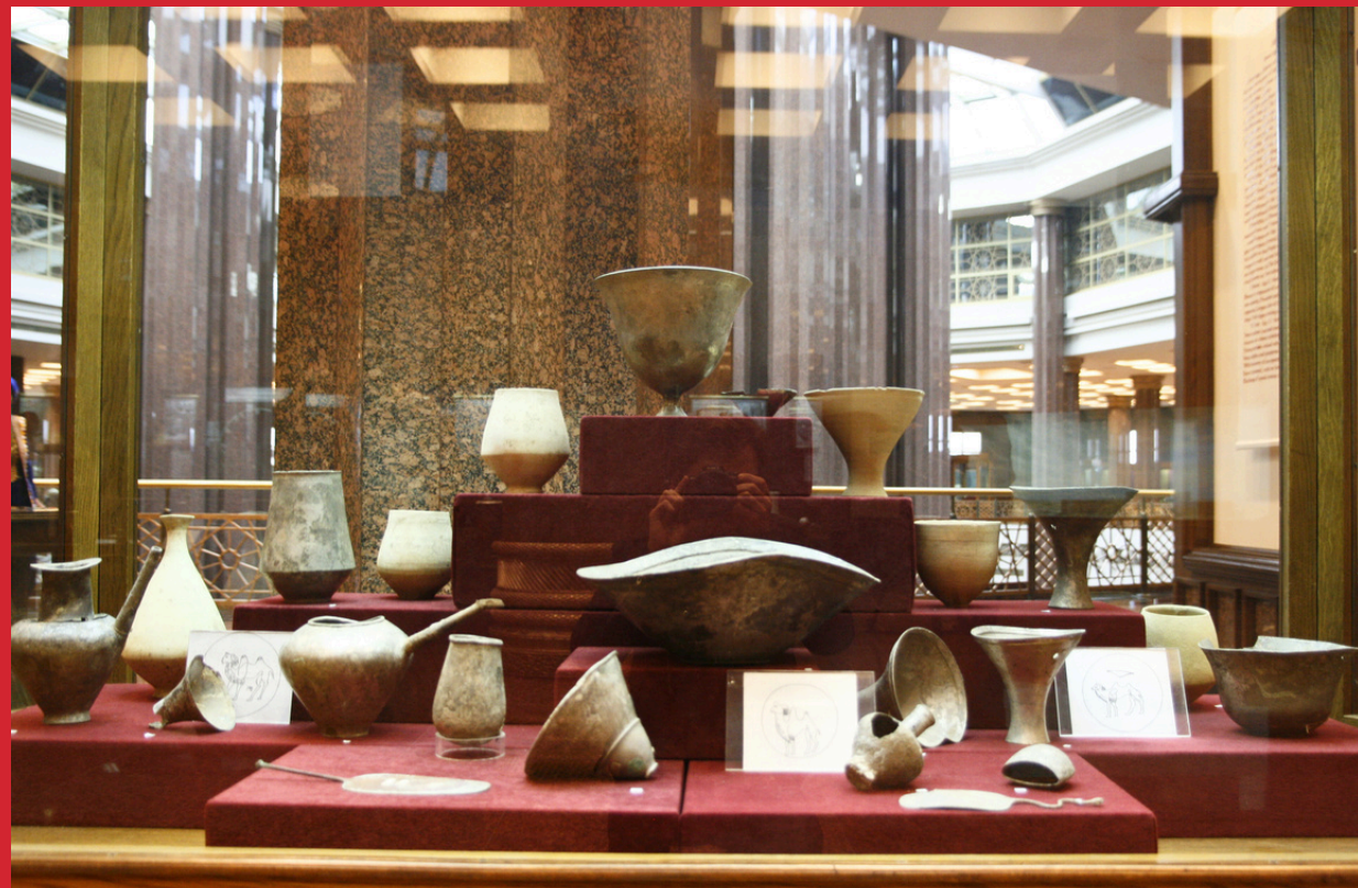
Zabytki z Gonur Depe, Epoka Brązu, (fot. Wojciech