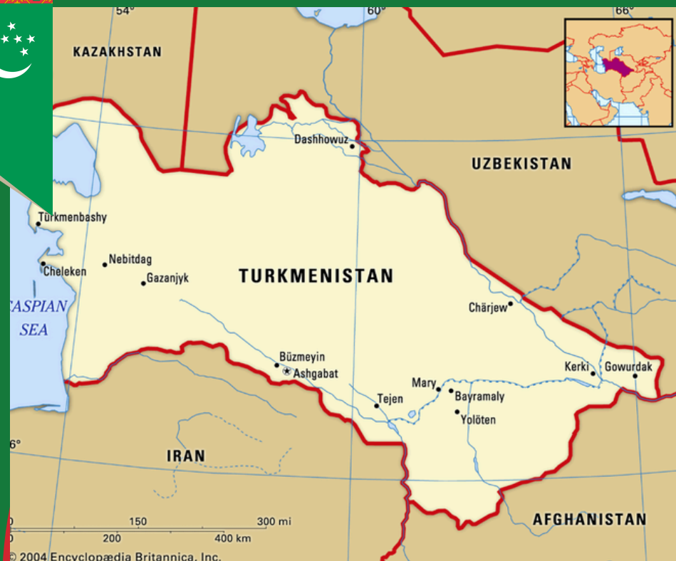
Mapa Turkmenistanu