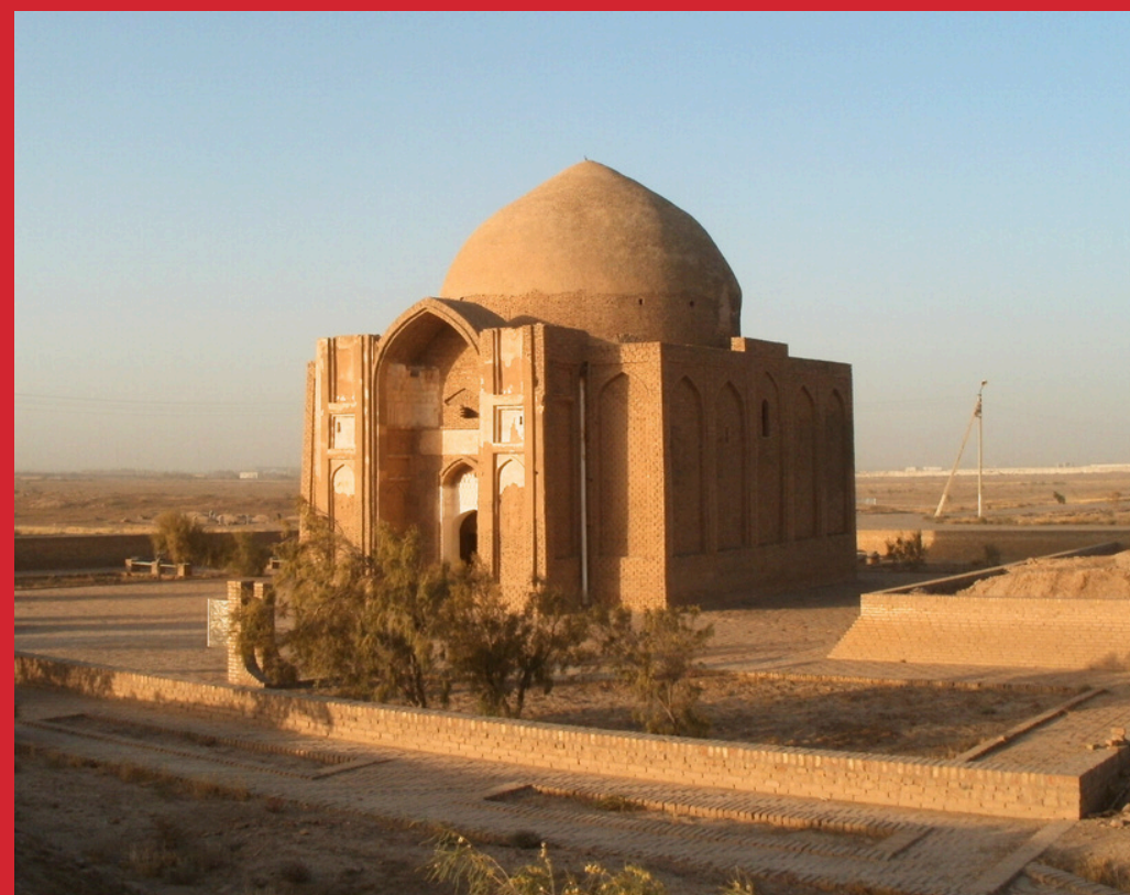
Stary Serachs, mauzoleum Abul-Fazl, XI-XII w.

W późniejszych latach prowadzono prace powierzchniowe w regionie oraz wykopaliska na stanowiskach Mele Hairam, Gurukly Depe, Gurukly Shaheri i Topazgala Depe.