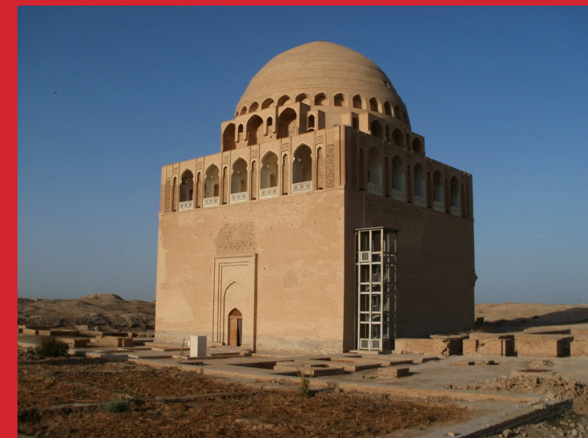
Merw, mauzoleum sułtana Sandżara, XII w.

Miasto Merw – ruiny starożytnego miasta, jednego z największych doby średniowiecza, wpisane na Listę Światowego Dziedzictwa UNESCO. Szczyt swojego rozwoju osiągnęło w epoce muzułmańskiej, na początku IX wieku zostało stolicą kalifatu arabskiego, a w XI–XII wieku – stolicą Wielkiego Imperium Seldżuckiego. W 1221 r. miasto zostało zdobyte i zniszczone przez Mongołów. W obrębie pozostałości miasta znajduje się kilka unikatowych zabytków: Kyz Kala – struktura prawdopodobnie powstała między VI a VIII w. n.e., najpewniej o funkcji obronnej. Monumentalne mauzoleum sułtana Sandżara (żył w latach 1118–57) pierwotnie stanowiło część dużego kompleksu religijnego.