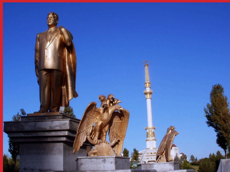
Aszchabad, pomnik Turkmenbaszy