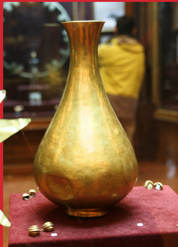
Złote naczynie z Gonur Depe, Epoka Brązu