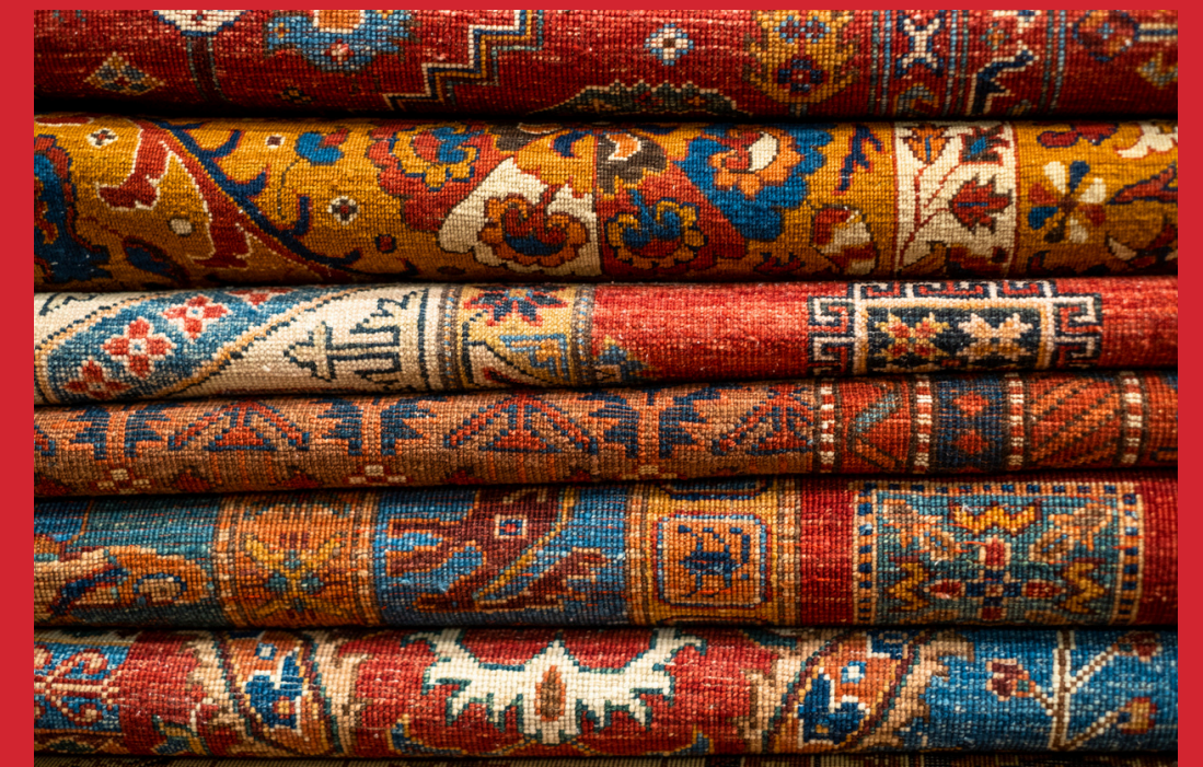
Wzory turkmeńskich dywanów