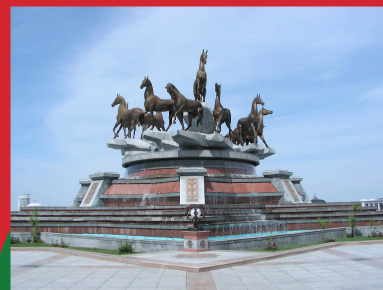
Aszhabad, fontanna z posągami koni Achał-tekińskich