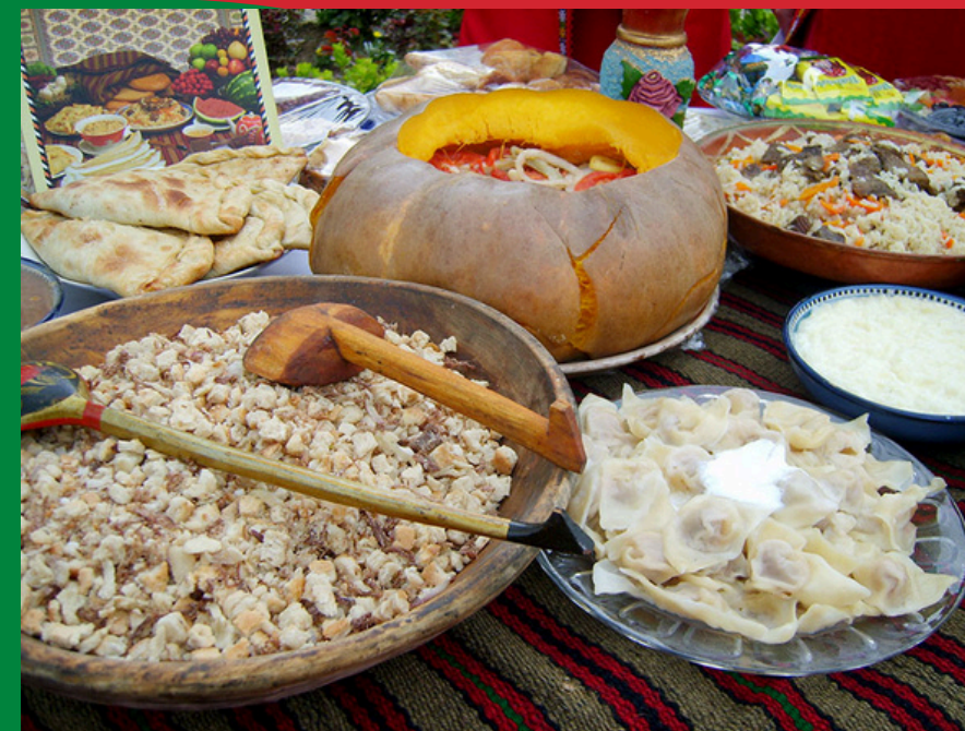
Tradycyjne dania