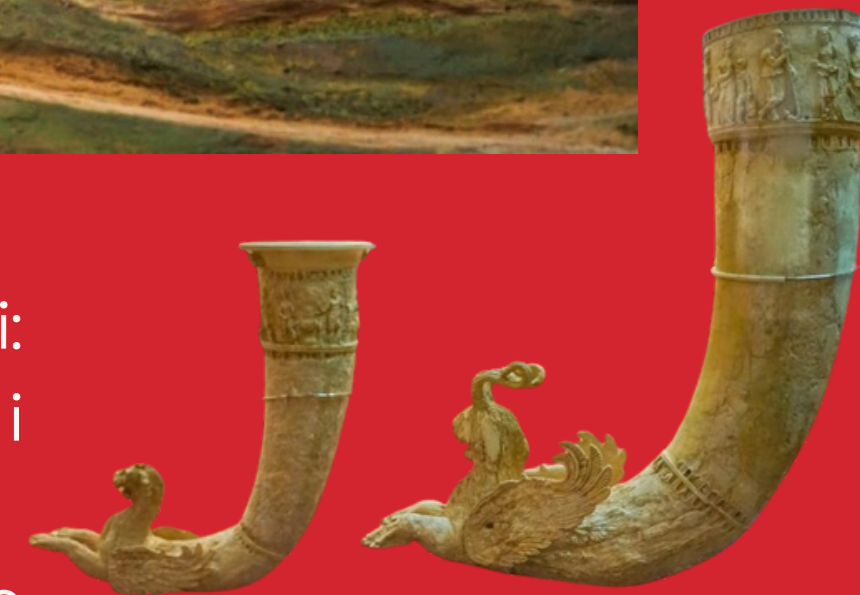
Rytony ze Starej Nisy, Epoka Hellenistyczna

Wykopaliska archeologiczne w dwóch częściach stanowiska odsłoniły monumentalne i bogato dekorowane budowle o funkcjach mieszkalnych, reprezentacyjnych i religijnych.