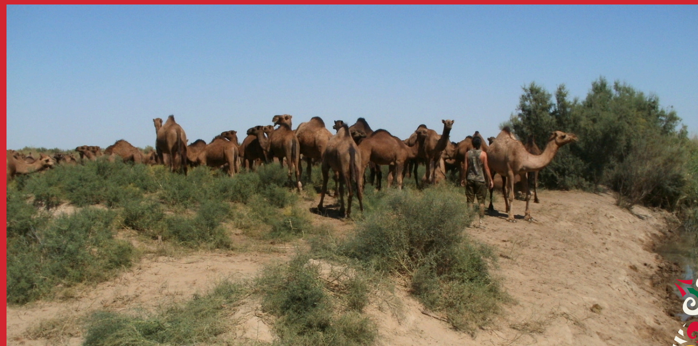
Wielbłądy w Oazie Merw