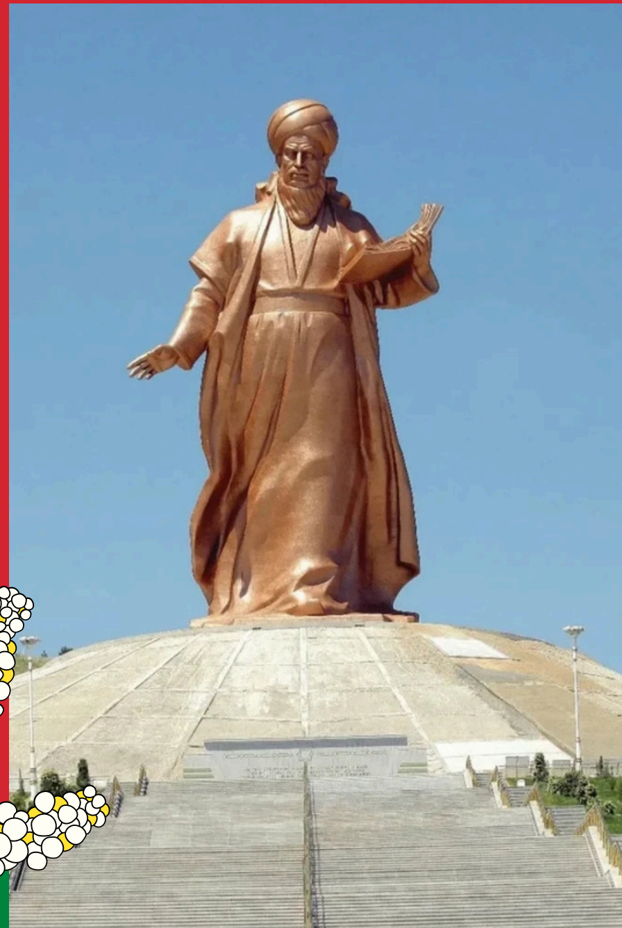
Posąg Magtymguly Pyragy w Aszchabad