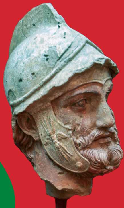
Stara Nica, wojownik w hełmie, czasy partyjskie