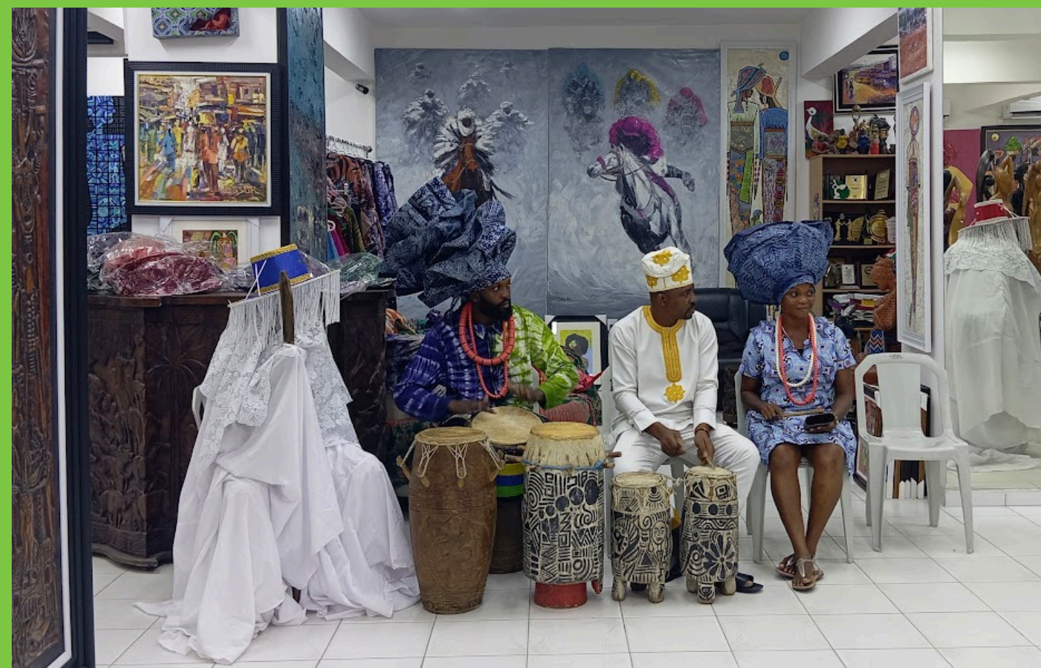
Zespół artystyczny w tradycyjnych strojach yoruba