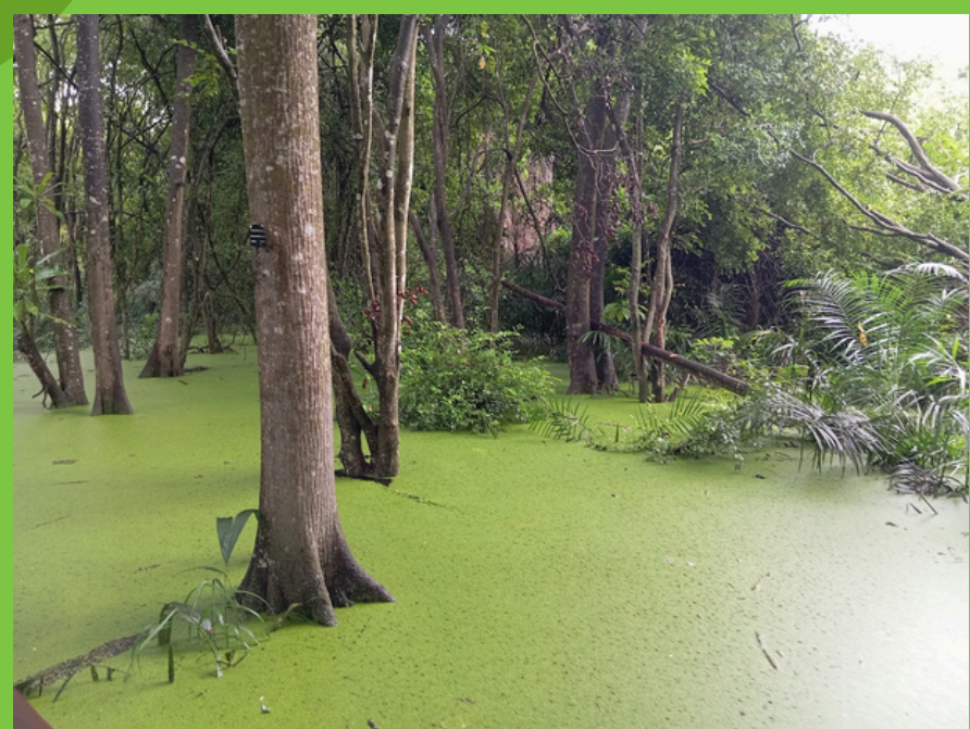
Lasy namorzynowe w okolicy Lagos

01 Nigeria, położona w zachodniej Afryce, jest największym krajem pod względem liczby ludności na kontynencie i jednym z najważniejszych krajów w regionie. Graniczy z Beninem na zachodzie, Nigrem na północy, Kamerunem na południowym wschodzie oraz Czadem na północnym wschodzie. Od południa ma dostęp do Oceanu Atlantyckiego. Stolicą Nigerii jest Abudża, jednak największym miastem kraju jest Lagos.