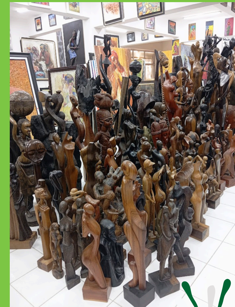
Nike Art Gallery w Lagos