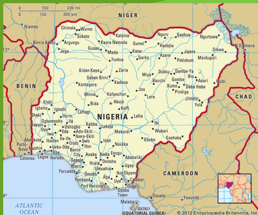
Mapa Nigerii

01 Nigeria, położona w zachodniej Afryce, jest największym krajem pod względem liczby ludności na kontynencie i jednym z najważniejszych krajów w regionie. Graniczy z Beninem na zachodzie, Nigrem na północy, Kamerunem na południowym wschodzie oraz Czadem na północnym wschodzie. Od południa ma dostęp do Oceanu Atlantyckiego. Stolicą Nigerii jest Abudża, jednak największym miastem kraju jest Lagos.