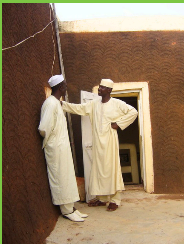
Mężczyźni w codziennym ubiorze hausa