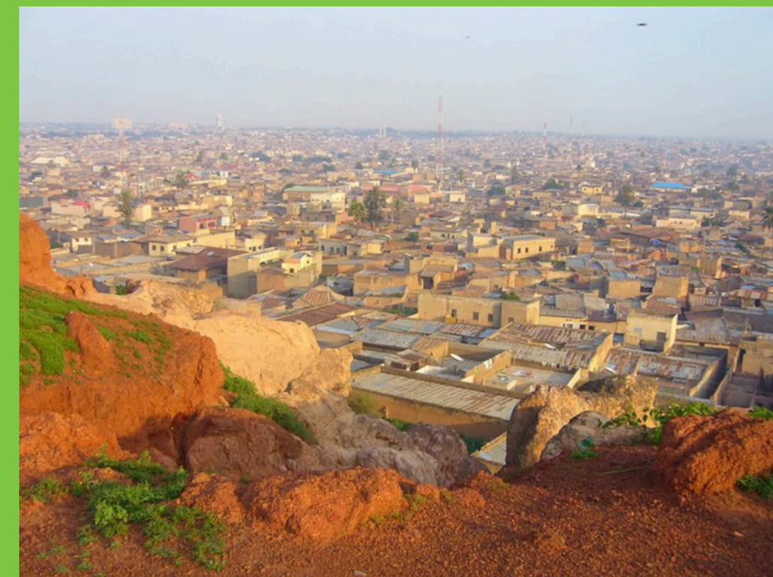
Panorama miasta Kano (Patrycja Kozieł)