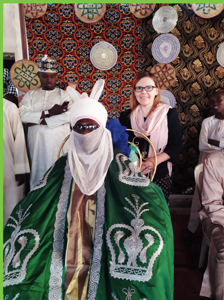
Podczas ceremonii w tradycyjnym stroju hausa