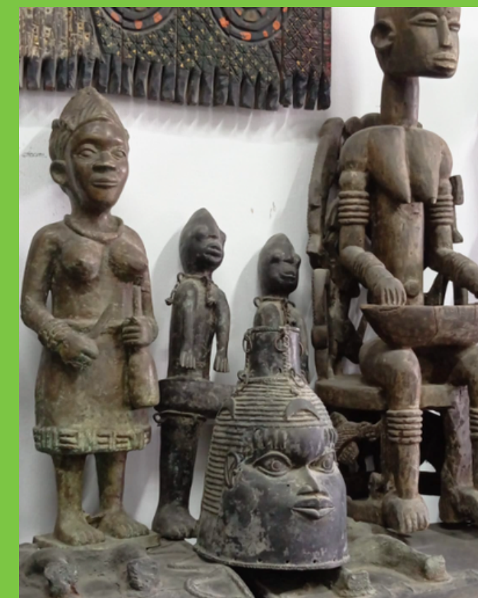
Słynne brązy z Królestwa Beninu - aktualnie Nigerii