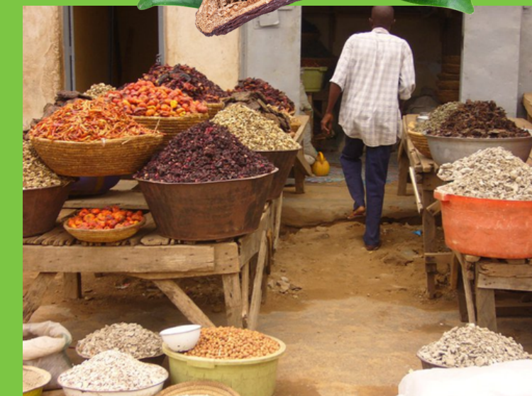
Targowisko w Kano (Patrycja Kozieł)