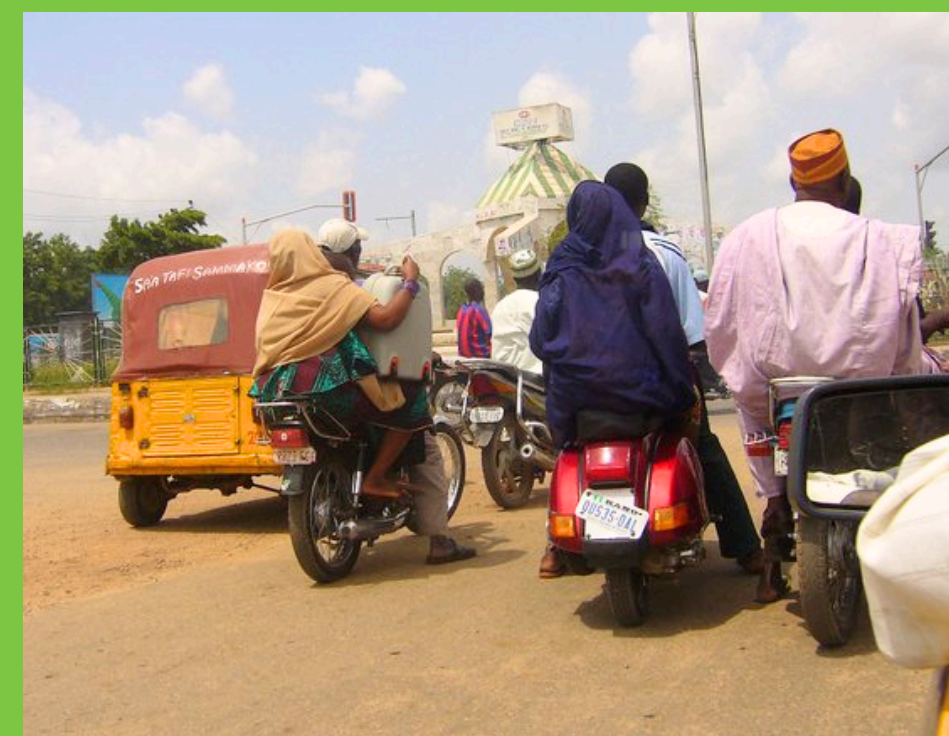
Zróznicowany transport w Nigerii

W Nigerii dostępne są różne środki transportu, zarówno nowoczesne, jak i tradycyjne. Najpopularniejsze środki transportu obejmują autobusy, samochody osobowe, taksówki oraz okada (motocykle) i keke (trójkołowe żółte riksze). W centralnej i południowej części kraju korzysta się także z transportu wodnego.