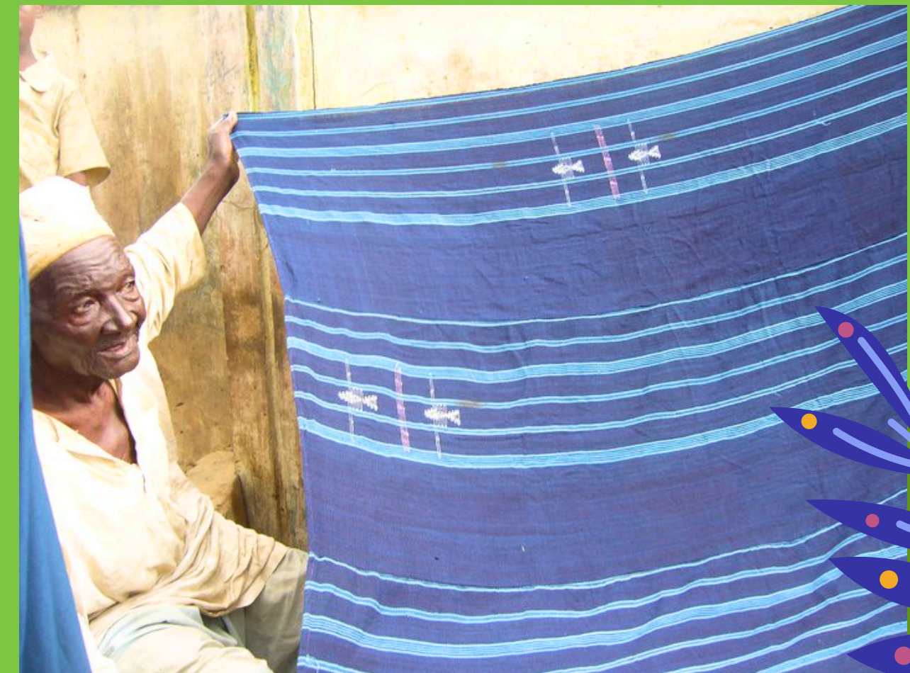
Sprzedawca tkanin w kolorze indygo - na targu w Kano

I tak zakończyła się ta bajka, a wszyscy żyli długo i szczęśliwie, pamiętając, że prawdziwa odwaga i współpraca potrafią pokonać każdą przeszkodę.