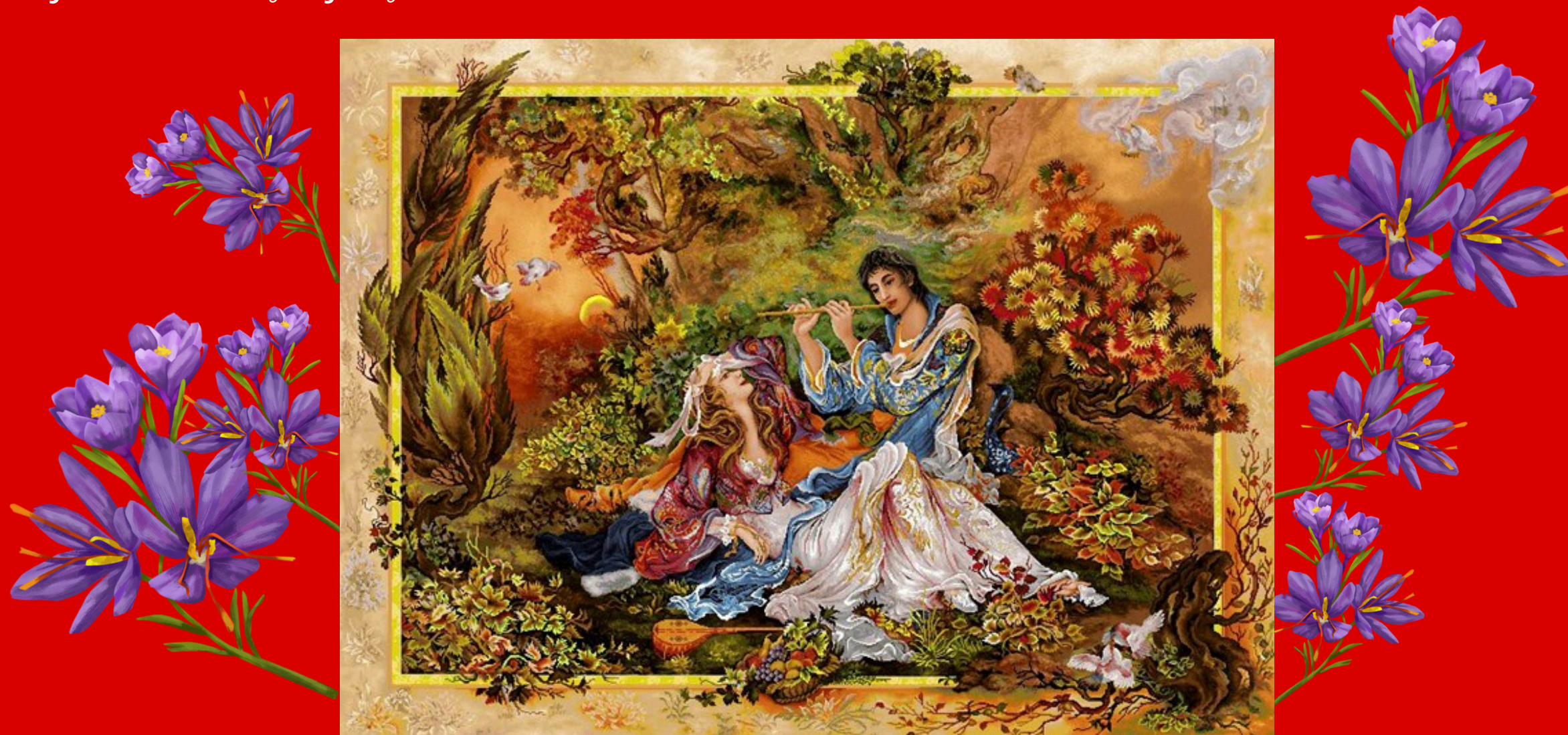
Dywan inspirowany opowieścią o Leili i Medżnun

„Leili i Medżnun” to starożytna arabska opowieść, którą później w wersji perskiej opracował Nizami. Opowiada historię młodzieńca zakochanego w swojej szkolnej koleżance Leili. Z powodu niezwykłego zachowania związanego z miłością, ludzie zaczynają nazywać go „Medżnun”, co oznacza „szaleniec”. Ich miłość jest silna, ale zakazana. Rodzina Leili zmusza ją do poślubienia innego mężczyzny. Medżnun, załamany, opuszcza społeczeństwo i zamieszkuje na pustyni, pisząc wiersze o swojej ukochanej. Leili nadal go kocha, lecz nigdy nie mogą być razem. Po wielu latach Leili umiera z tęsknoty, a Medżnun umiera wkrótce potem przy jej grobie. Ich historia staje się symbolem głębokiej, niekończącej się miłości.