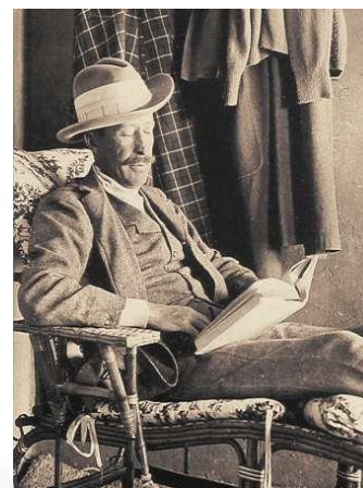
George Edward Carnarvon